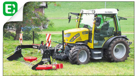
Präsentiert wird der neue Rigitrac SKE 50 Electric. [ / Hinter diesem Bild verbirgt sich eine Bildergalerie, die mit der Extra-App aktiviert werden kann.]