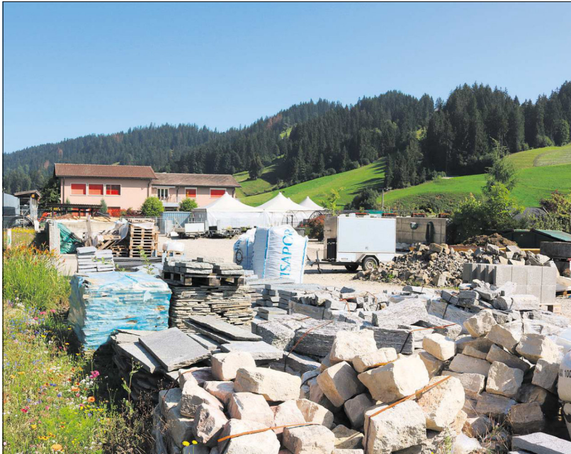
Entgegen dem Kanton hat die Gemeinde im nördlichen Bereich des Weilers Färberhus, Schärli, eine Sonderbauzone mit Gestaltungsplanpflicht festgelegt.

Ein zentrales Element bildete dabei die Umsetzung der interkantonalen Vereinbarung zur Harmonisierung der Baubegriffe, welche unter anderem die Gesamthöhe bei Gebäuden definiert. Die Ausnutzungsziffer (AZ) wurde abgeschafft und mit der Überbauungsziffer (ÜZ) ersetzt, die den Fussabdruck eines Gebäudes auf dem Grundstück begrenzt. Im Weiteren muss Escholzmatt-Marbach zehn Hektaren Bauland zurückzonieren – dies wird jedoch erst mit einer späteren Teilrevision erfüllt.